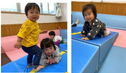
運動マットで遊んだよ♪